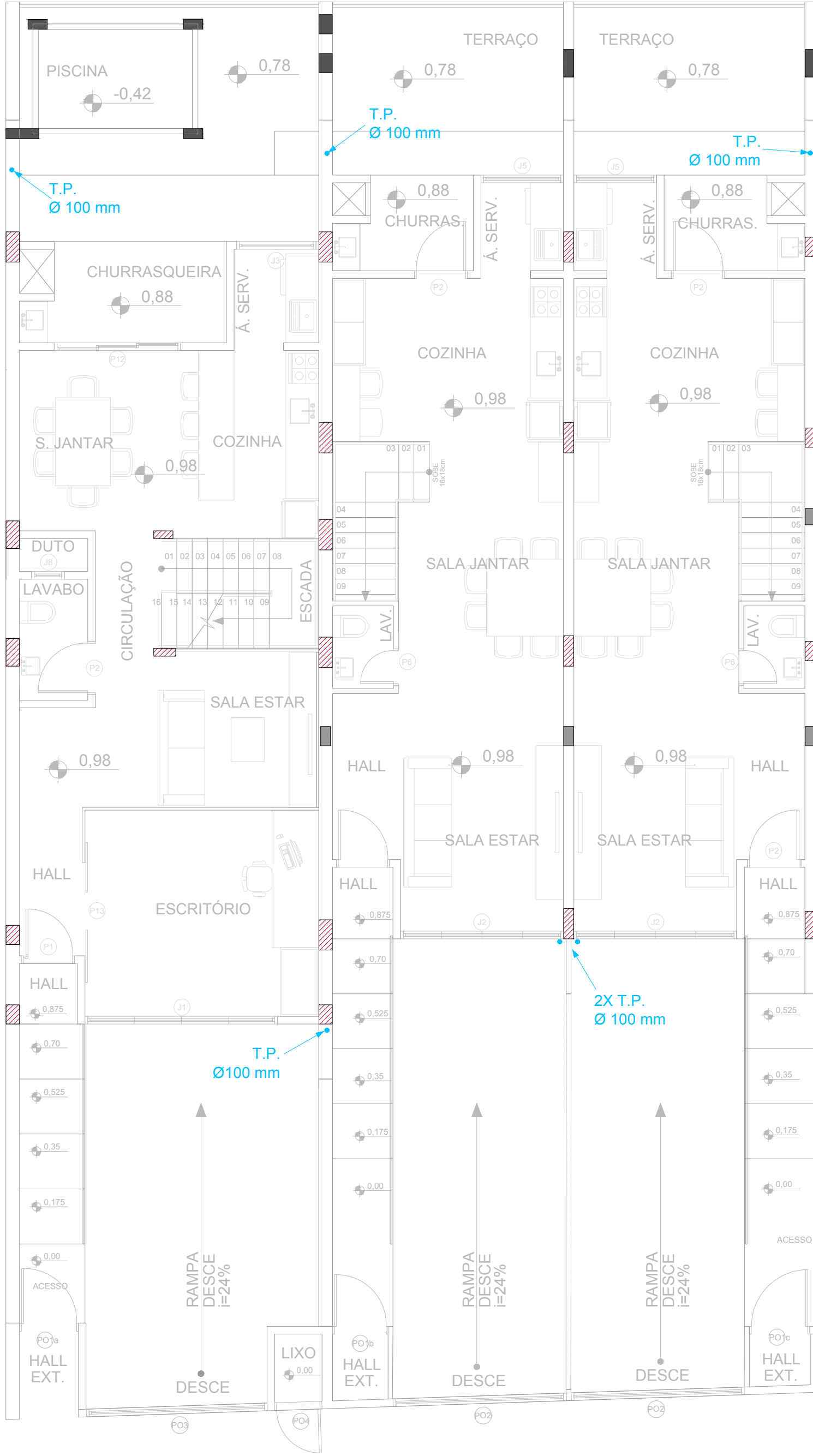
Térreo Nível + 98